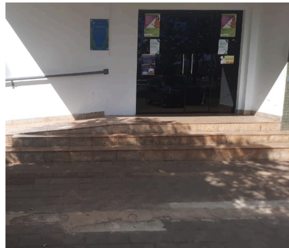
*Imagem2- Projeto da perspectiva após a instalação